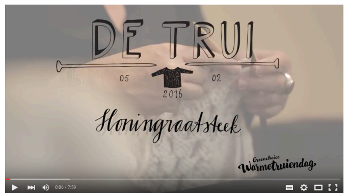
Instructiefilm 3: Honingraatsteek | Brei De Trui Van 2016

Bekijk de instructiefilmpjes op de website: www.warmetriendag.nl/brei-mee of youtube kanaal "warmetriendag 2016"