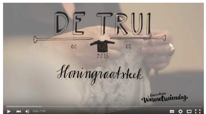
Instructiefilm 3: Honingraatsteek | Brei De Trui Van 2016

Bekijk de instructiefilmpjes op de website: www.warmetriendag.nl/brei-mee of youtube kanaal "warmetriendag 2016"